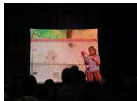
Divadlo pro děti „NaVlnce“

Od konce 90. let pořádáme v lesoparku Les snů červnové grilování, které postupně přerostlo v oslavu Dne dětí. Kromě toho se