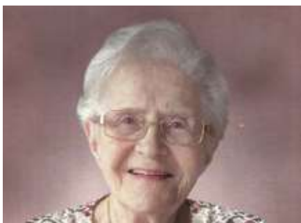
Zdeňka Makoňová