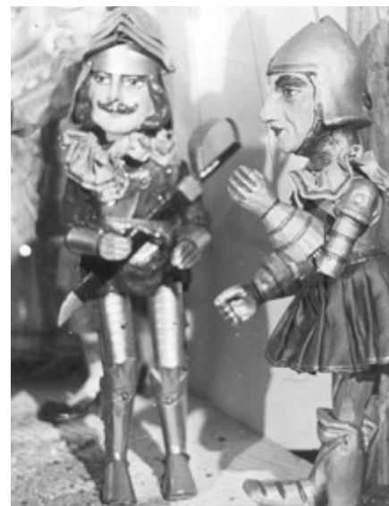
Loutky loupežníka a rytíře

V meziválečném období nežili naši krajané jen v Bruselu a Antverpách, ale přicházeli i do jiných, převážně hornických regionů.