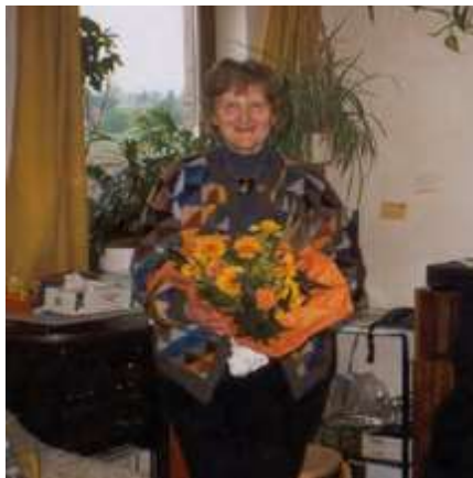
Zora Papežová

V roce 1997 vyšlo první číslo Zpravodaje , s nápadem přišla tehdejší předsedkyně Zora Papežová , byl to však jen občasník.