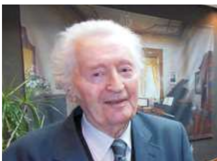
Ján Valach