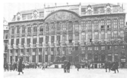
Dům Brabantských vévodů, 30. léta

probíhala výuka v češtině. Při spolku byl založen pěvecký a divadelní kroužek. V Bruselu fungovala i sokolská jednota. Skvělou vizitkou naší kultury se stalo loutkové divadlo , které se v polovině 30. let modernizovalo. Byla v něm např. elektrická fontána, mlýn na tekoucí vodu, kouřící mlíže. Představení probíhala ve spolkové místnosti v Domě brabantských vévodů na Grand-Place. Po válce loutky dlouho odpočívaly, nebyli loutkaři. Koncem 80. let výbor rozhodl věnovat loutky ČSÚZ v Praze, kde mělo vzniknout krajanské muzeum. K tomu však nedošlo a loutky se po roce 2000 opět vrátily do Belgie. Byly však použity jen jednou v roce 2009 na Mikulášské nadílce, tak bohužel nadále leží v krabici.