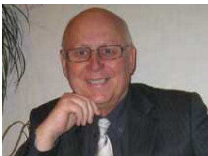
Mirek Černý © foto z archivu Besedy