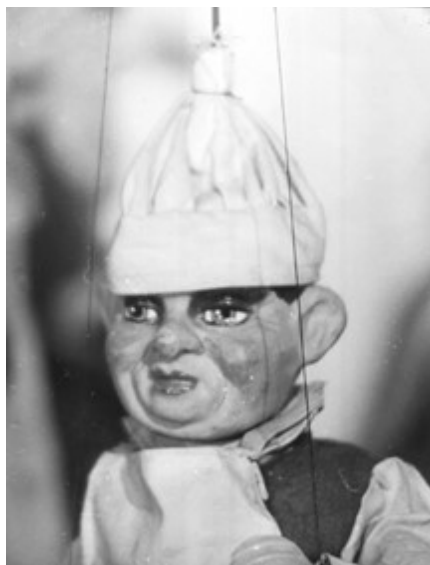
Loutka řezníka

Počet starousedlíků se v roce 1925 odhadoval na 1000 osob, v roce 1935 zde žilo podle belgických statistik přes 9 600 dospělých Čechoslováků. Meziválečná léta byla pro Besedu Volnost velmi úspěšná. Krajané pořádali přednášky, rozšiřovali krajanskou knihovnu, pro děti organizovali dýchánky, návštěvy muzeí a výlety do přírody. Díky podpoře československého ministerstva osvěty mohli pronajímat třídy ve škole, kde ve čtvrtek odpoledne a v neděli dopoledne