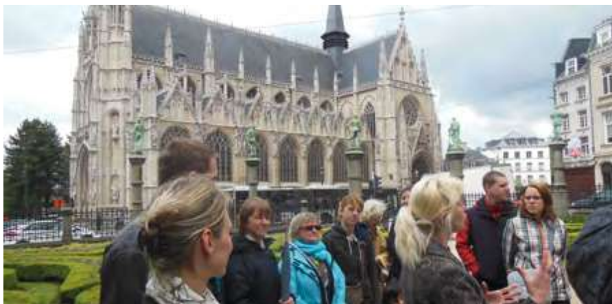
Procházka po Bruselu, 2013

řenými penězi hospodaříme zodpovědně. Děkujeme našim zastupitelským úřadům a dalším našim zastoupením v čele s Pražským domem za jejich vstřícnost a podporu. I my se snažíme pomáhat ostatním. S podporou Besedy v letech 2008 a 2009 za-