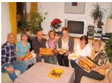
Vánočky, 2010

scházíme v Pražském domě na dýcháncích, které většinou mají hudební nebo literární náplň. Pro krajany jsme pořádali též taneční zábavy (v roce 2016 jsme na Řehořské zábavě zpívali ke kulatým narozeninám Zdeňkovi Svěrákovi). Pro děti pořádáme divadelní představení, pro dospělé monodramata ( Osamělé večery Dory N, Z deníku hrábenky M, To je ON! ) koncerty vážné i po-