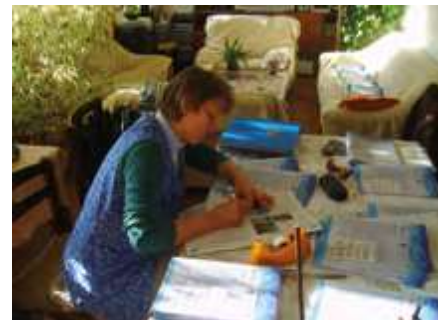
Zpravodaj před distribucí

S výjimkou letních prázdnin zveme krajanu na naše akce každý měsíc, někdy i několikrát. Po celou dobu existence pořádá Beseda Mikulášskou nadílku, v počátcích vánoční i novoroční. Do roku 2007 to bylo formou taneční zábavy s českou kapelou, v dalších letech s tvořením pro děti nebo s divadelním představením.