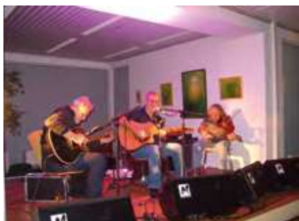
Michal Prokop, 2010