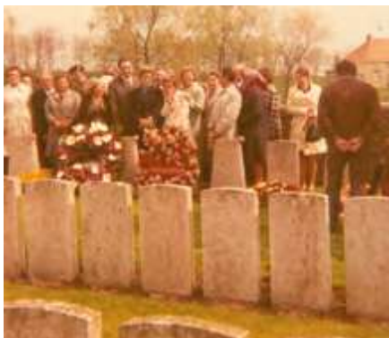
Adinkerke, 70. léta