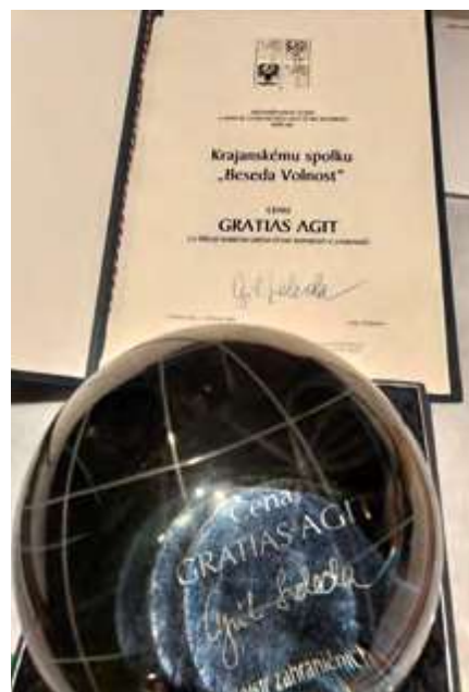
Cena Gratias agit

Beseda byla založena jako filantropický spolek a jako takový vždy pomáhala potřebným ve svých řadách. Pořádala též sbírky na různé dobročinné účely, např. v roce 1914 na Husův pomník, v roce 1921 na sirotky po československých legionářích, v letech 1936 a 1938 poslali krajane do ČSR značnou sumu na obranu republiky. V roce 1947 uspořádali sbírku na znovuoživení Lidic, v roce 1955 na založení lidického růžového sadu.