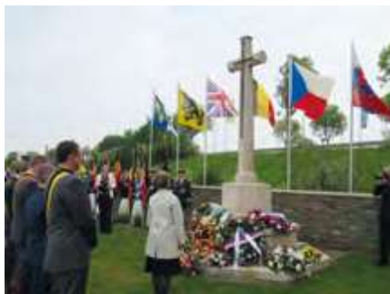
Adinkerke, 2019

Na konci 60. let objevili krajané z Besedy Volnost vojenský hřbitov v Adinkerke poblíž De Panne, kde je pochováno přes 40 československých vojáků padlých při osvobození Belgie v roce 1944. První pietní akce se v Adinkerke konala za účasti zástupců československého velvyslanec-