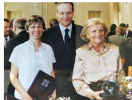
Předávání ceny Gratias agit

V této tradici pokračujeme i v dnešní době. V roce 1990 byla za podpory profesora Klášterského uspořádána sbírka na pomoc dětskému onkologickému oddělení motolské nemocnice, 288 400 BEF (7 210 eur) bylo převedeno firmě Janssen Pharmaceuticals, která nemocnici vydávala potřebné léky. V roce 1997 jsme uspořádali sbírku na pomoc Moravě postižené povodněmi, vybrané peníze 26 400 BEF (660 €) dostala obec Bochoř. Stejně jsme reagovali po povodních v Čechách v roce 2002, obec Hořín na Mělnicku dostala od nás na opravu místní školy 3000 eur. Za šíření dobrého jména České republiky v zahraničí, za filantropickou činnost, udržování českých tradic a pomoci nově přichozím dostal náš spolek od Ministerstva zahraničních věcí ČR v roce 2004 Cenu Gratias agit .