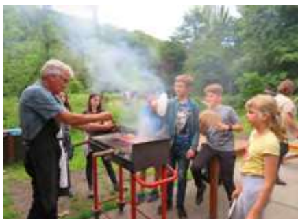
Grilování, 2019