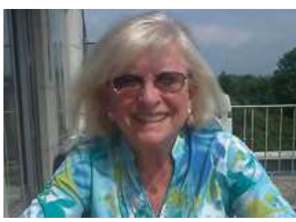
Alena Gilbert © foto z archivu Besedy