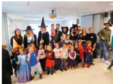
Čarodějnický rej, 2022

pulární hudby (harfenistka Jana Boušková, Gentlemen Singers, Trio Samson-Redl-Janoušek, Michal Prokop ). Neutuchající zájem je o akce pro děti, kromě Mikuláše a dětského dne pořádáme také Čarodějnický rej. Několikrát se uskutečnilo společné andělské pečení a vaření, kde jsme se učili vařit a péct česká jídla. Od roku 2005 každý rok společně pečeme vánočky.