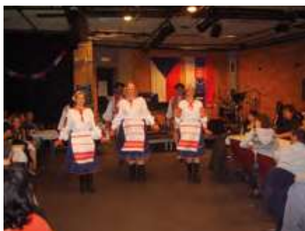
Folklor a zábava, 2012

scházíme v Pražském domě na dýcháncích, které většinou mají hudební nebo literární náplň. Pro krajany jsme pořádali též taneční zábavy (v roce 2016 jsme na Řehořské zábavě zpívali ke kulatým narozeninám Zdeňkovi Svěrákovi). Pro děti pořádáme divadelní představení, pro dospělé monodramata ( Osamělé večery Dory N, Z deníku hrábenky M, To je ON! ) koncerty vážné i po-