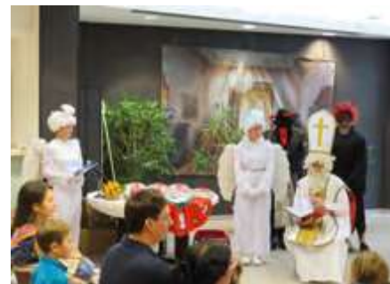
Mikuláš, 2019

S výjimkou letních prázdnin zveme krajanu na naše akce každý měsíc, někdy i několikrát. Po celou dobu existence pořádá Beseda Mikulášskou nadílku, v počátcích vánoční i novoroční. Do roku 2007 to bylo formou taneční zábavy s českou kapelou, v dalších letech s tvořením pro děti nebo s divadelním představením.