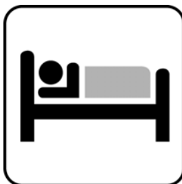
Réservations des hôtels