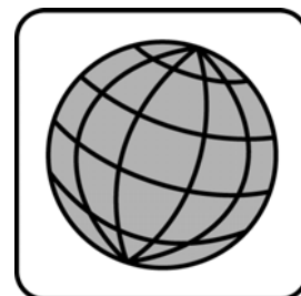
Tour du Monde