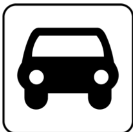
Location de voitures