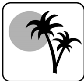
Séjours et circuits