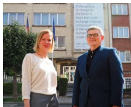
Grow our humanity

Následujících pár řádků bych rád využil ke krátkému ohlédnutí za končícím a tolik neobvyklým rokem. Velmi si vážím úsilí krajanských spolků a České školy bez hranic, které i navzdory všem překážkám v rámci možností pokračují ve svých aktivitách. Jsem velmi rád, že se nám ve spolupráci s Českým centrem v Bruselu podařilo zrealizovat několik opravdu zajímavých projektů, které nejen poukázaly na českou přítomnost v Belgii, ale které zároveň vždy dokázaly povzbudit v ten pravý okamžik. Chtěl bych na tomto místě srdečně poděkovat všem krajanům, kteří se zapojili do naší jarní iniciativy šití roušek pro XL. Česká pomoc byla radnicí Ixelles vřele přivítána. Dále bych chtěl připomenout krásnou letní kampaň #GrowOurHumanity, která do ulic Bruse-