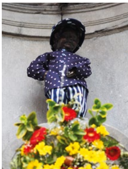
Čurající chlapeček

Bronzová soška malého chlapce stojí v hlavním městě Belgie už přes 400 let. Její šatník čítá