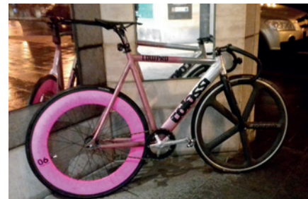
Frajeřina o dvou kolech.

Katka, která jezdila na své šik skládačce do práce až do posledních chvil – rozumějte kontrakcí – svého radostného očekávání. Za pár týdnů po porodu už drandila po městě na kole se svým novorozencem synkem uvázaným do šátku. Ostatně s dětskou posádkou jezdí rodiče v dešti, sněhu, mrazu i vichřici.