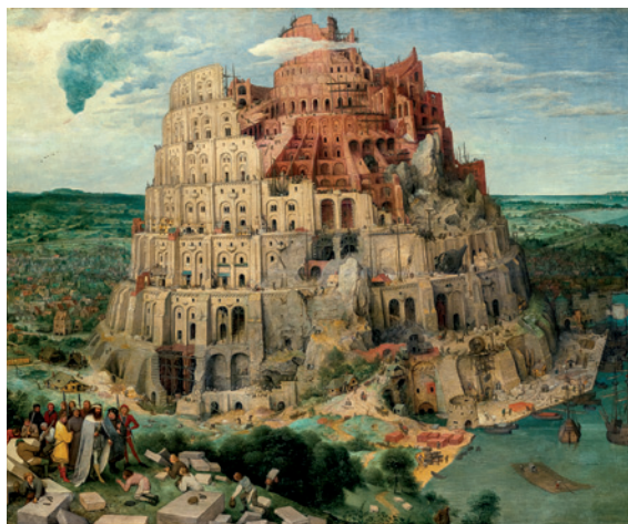
Babylónská věž © ilustrační foto

Vynikal schopností malovat běžný mumraj i krajinky s excelentně detailní pečlivostí a hloubkou. Novátorskému umělci 16. století, jenž svými obrazy nadchnul i císaře Rudolfa II., navíc nebyly cizí satira a nadsázka. Svět Pietera Bruegela staršího letos v Belgii ožívá na několika výstavách a akcích, a to při příležitosti uplynutí 450 let od umělcova úmrtí.