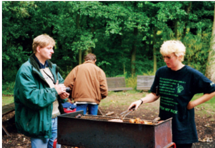
BBQ v září 1998