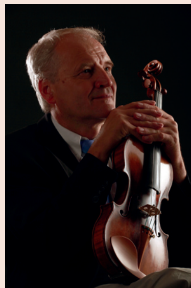
Jaroslav Šonský © foto archiv J. Šonského