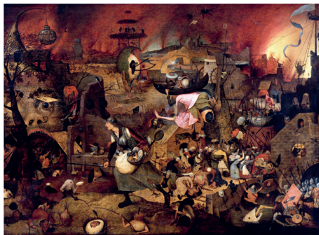
Bláznivá Markéta © ilustrační foto

Bruegel miloval ptačí perspektivu. Vsadila bych se, že kdyby žil v naší době, sledoval by cvrkot ve městě kamerou umístěnou na létajícím dronu a po večerech by koukal