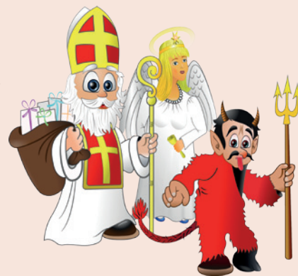
ilustrační foto mikuláš