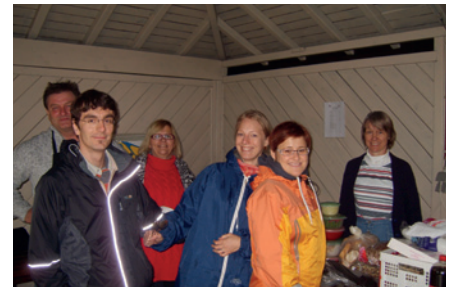
BBQ v červnu 2012