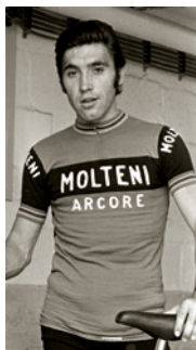
Eddy Merckx (1973)

Brusel je specifický cyklistický případ nejen pro závodníky, ale i pro obyčejné „šlapálisty“. Nemá sice takové kopce jako například Praha, ale placka jako Kodaň nebo Amsterdam to rozhodně není. V jeho výškově nevyrovnaném reliéfu se dost nadřeje. Kromě náročnějšího terénu, nevyzpytatelného počasí a dennodenních dopravních zácp musíte počítat i s tím, že cesty a úzké ulice nejsou v nejlepší kondici. Přesto se v Bruselu na kolech, elektrokolech, luxusních skládačkách, koloběžkách, elektrických trottinette , retro silničkách, obstarožních „horáčích“, co už mají za sebou několik kolizí, zrezivělých veteránech, elegantních klasikách, bytelných holandských a robustních německých bicyklech s vozítky pro rozvoz zboží, vytuněných hipsterských krasavicích, elektrických monokolech, lehokolech, speciálních vélo cargo s elektrickým motorem a nosičem pro děti (případně psy) někdy s bakelitovou střechou nebo vtipné le tandem pro dvě osoby prohánějí jak studenti, tak i bruselští euroúředníci. Celkem běžně potkáte nastrojené dámy v kostýmcích a lodičkách na jehličkových podpatcích, které neztrácejí nic ze své elegance ani na kole. Nejvic mě asi šokoval mladý tatiněk, když na rozvrzaném horském kole vezl sebe a tři děti – jedno v přední sedačce, druhé v zadní a v zadu na speciální spodní ližině ještě miminko. Nebo kamarádka