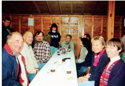
BBQ v září 1998