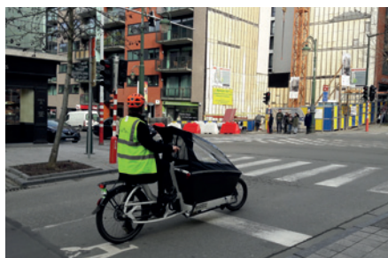
Speciální bicykl do každého počasí.

Tento pozoruhodný sportovec mluvil vlámsky i francouzsky, i proto ho milovala celá země. Merckxova éra poznamenala šedesáté a sedmdesáté roky. Média tehdy psala o Planétě Merckx nebo o merckxismu. Měl široký úsměv a neskutečné řasy, prý nejdelší a nejoslavovanější ve světě sportu. „Hladový bojovník“, jak se mu také přezdívalo, vypadal jako pravý závodník – čepička