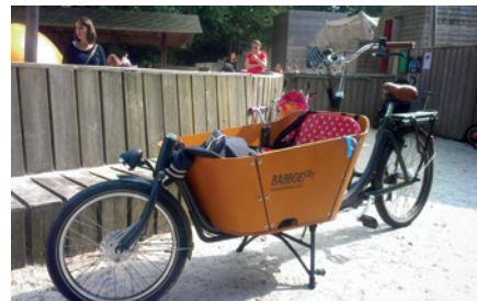
Robustní kolo, které malé děti milují.

Pro cyklistu není o moc horších chvil, než když z vyhráté pracovní židle přesedne na vodou nacucané sedlo. Není tedy od věci na sedlo ráno natáhnout spásnou igelitku či mikrotenový sáček a upevnit ho gumičkou. Zkušené praktici to dělají preventivně.