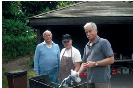
BBQ v červnu 2009