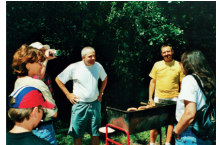
BBQ v červnu 2000