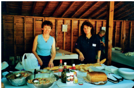
BBQ v červnu 2000