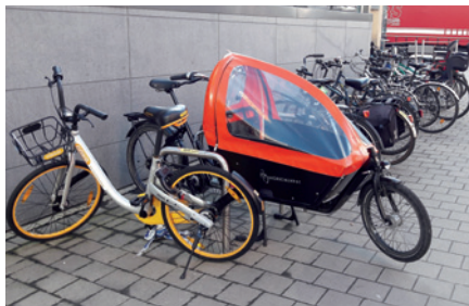
V Bruselu počty cyklistů každoročně rostou.

s krátkým kšiltlem, dres a silniční kolo. Bez mrknutí oka dokázal v kopci ujet všem. Jedním z jeho největších soupeřů byl Vládm Roger de Vlaeminck, řečený Bestie z Eekla.