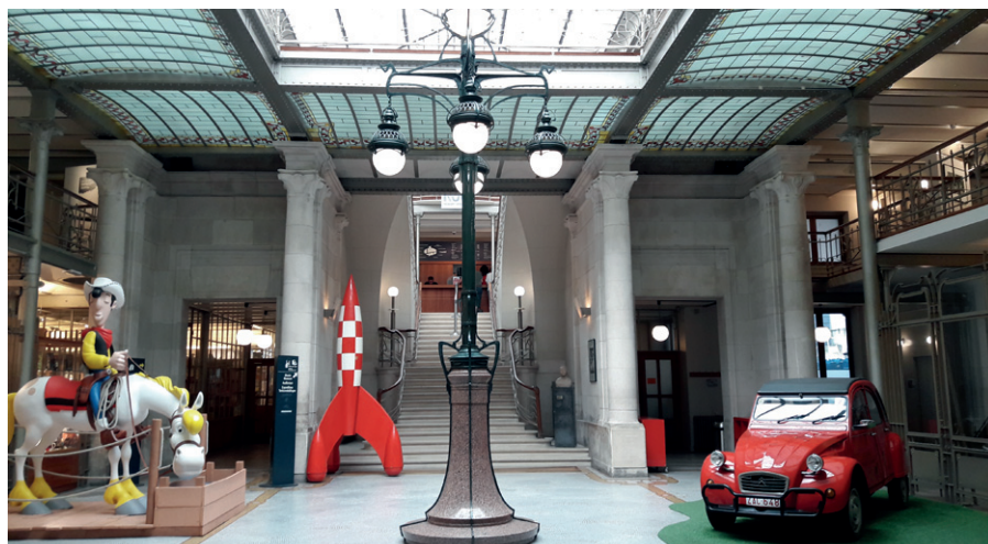
Belgické centrum komiksu

Horta rozvinul nové estetické a technické možnosti skla a oceli. Tvrdil: „Když máte ocel, nepotřebujete zdi.“ Železnou konstrukci neschovával, ale hrdě ukázal