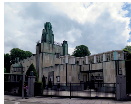
Palác Stoclet

Hvězdná architektura, na půli cesty mezi art nouveau a art deco, z dílny českého rodáka Josefa Hoffmanna se tyčí u jednoho z širokých bruselských bulvárů. Palác