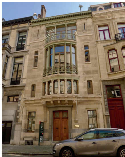
Hotel Tassel