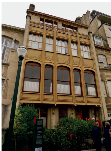
Hotel Van Eetvelde