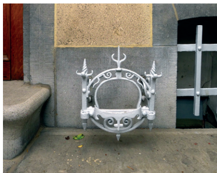
odbávač na boty

V mnoha ohledech inovativní obydlí ve Schaerbeeku zdaleka nedosahovalo úrovně revolučního Hôtelu Tassel (Tasselův dům; Rue Paul Emile Janson 6), jenž vznikl ve stejné době a kde mohl Horta zcela popustit svou fantazii a um, neboť jej neomezovaly finanční možnosti klienta. Hôtel Tassel je považován za historicky první stavbu zcela vytvořenou ve stylu art nouveau. Přestože měl Horta po ruce nejlepší řemeslníky a návrháře, včetně mistra vitráží Tiffanyho, domy do posledního detailu, fasetky, navrhoval sám, včetně zvonků a mých oblíbených venkovních „odbávačů“ na boty, které vypadají samy o sobě jako malá umělecká