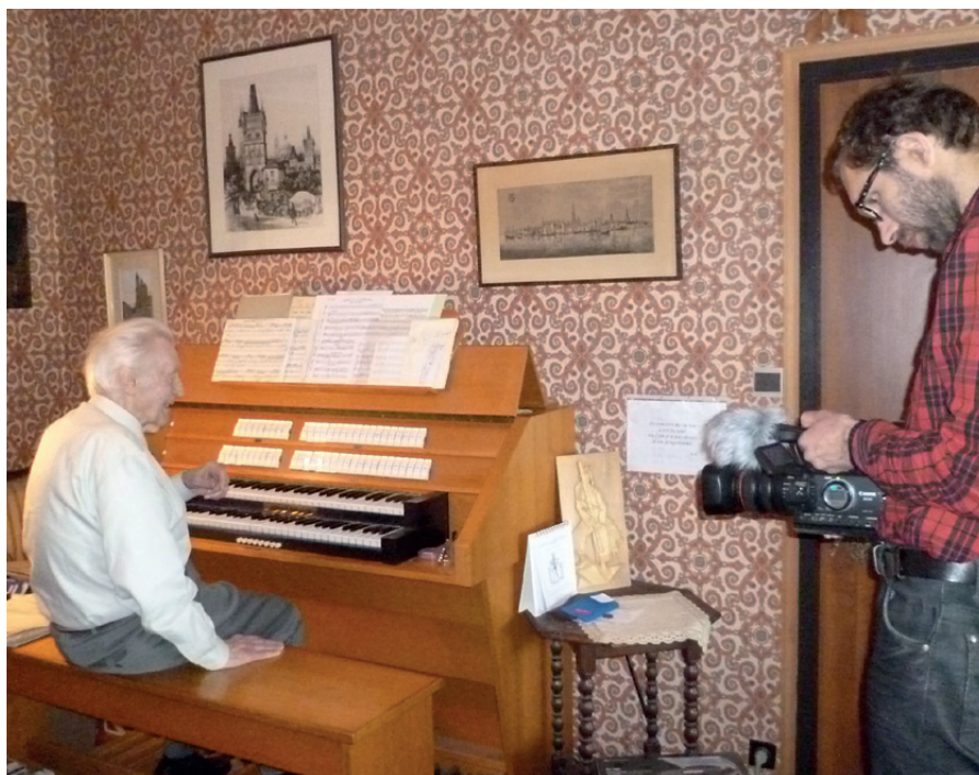
Ján Valach © foto z archivu Českých kořenů

Iva Mrázková , skvělá výtvarnice a současná honorární konzulka, neutuchající iniciátorka kulturních a společenských akcí, které spojuje Čechy (i Slováky) v Lucembursku. Ráda pracuje s mladší generací tamních Čechů, kteří jsou zde velice aktivní, podporuje dětské výtvarné talenty.